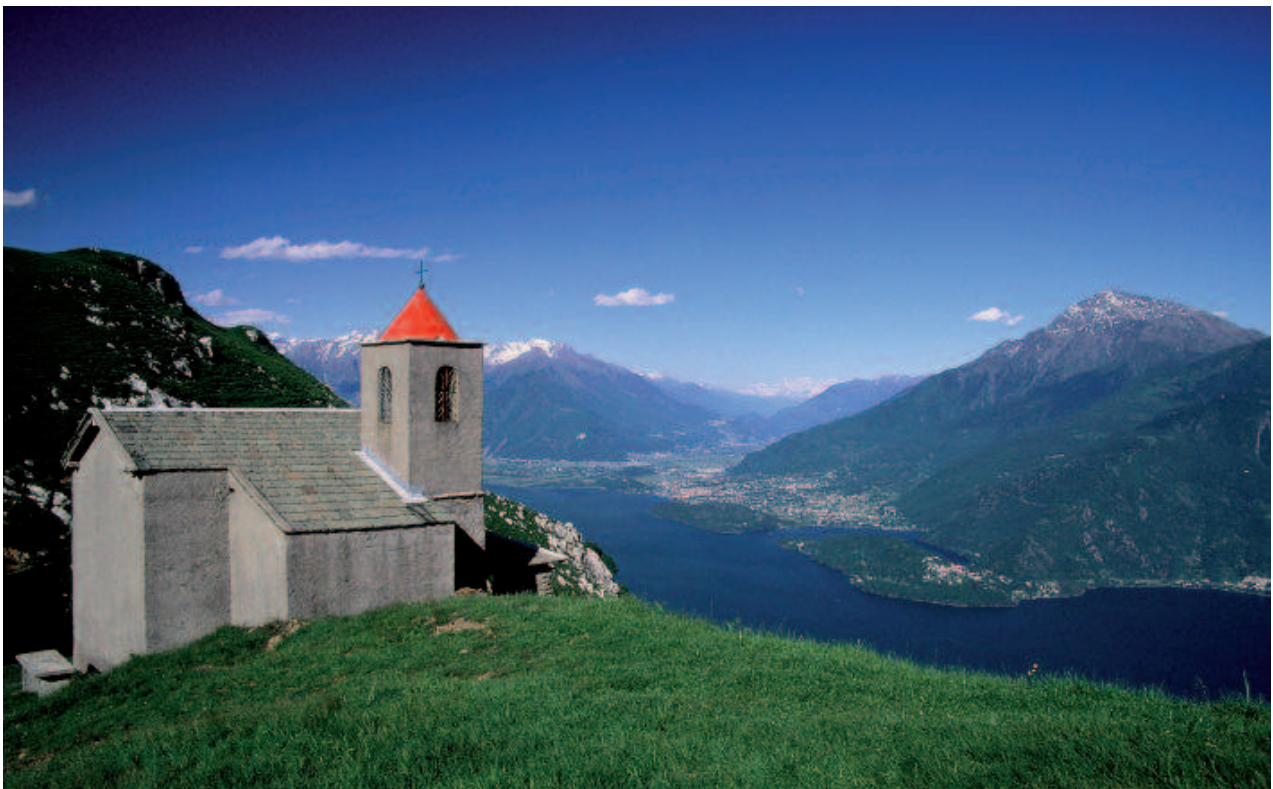
San Bernardo

N.B. Per chi comincia questo tratto della VIA dei Monti Lariani a Breglia: dalla fermata dell'autobus si imbecca la strada a sinistra che sale a Rifugio Menaggio (1.30 ore da Breglia) e la si segue per ca. 50 m. fino giungere a un residence di nuova