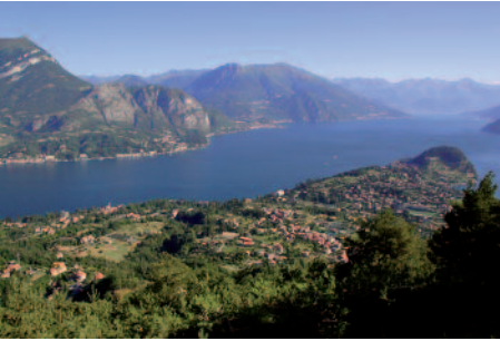
Vista su Bellagio

PIAN DEL TIVANO (m.957 s.l.m.) - fermata del bus - posti di ristoro - alloggi - può essere raggiunto con l'autobus C32 da Nesso. È una vasta conca circondata dalle pendici del monte S. Primo , del monte Cippei e della Braga di Cavallo ; verso occidente è sbarato dal "Dosso", una morena deposta dal ghiacciaio Lariano. Il piano è famoso per la fioritura di narcisi, genziane e mughetti (flora protetta). Chi giunge al Pian del Tivano in autobus prosegue dalla fermata per circa 20 minuti sulla strada asfaltata. All'altezza dell'ex impianto di risalita (per sciatori), presso l'agriturismo Binda, s'imbocca la strada agricola che risale la Val di