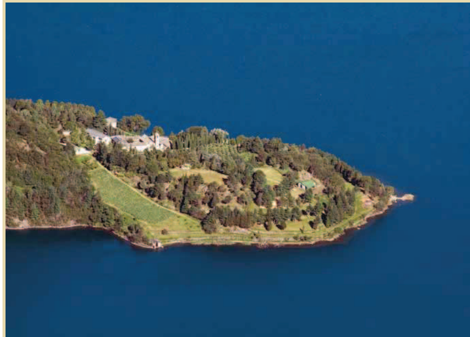
L'Abbazia di Piona vista dalla vetta del Legnone (25 luglio 2007).

L'Abbazia di Piona sorge ai piedi del monte Legnone, sulla collina di Olgiasca, a due passi dalla riva del Lago di Como nel comune di Colico. Le prime fonti che attestano la presenza in questo territorio di una comunità monastica risalgono al VII secolo. Sono stati trovati documenti del XII secolo che dimostrano la vitalità anche economica dell'Abbazia di Piona a quei tempi.