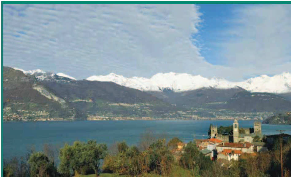
Verso Corenno Plinio (2 dicembre 2009).