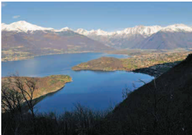
Il Laghetto di Piona (2 dicembre 2009).

Lasciamo a dx l'accesso a Ca' Biasett e continuiamo su sterrato in direzione della Torretta.