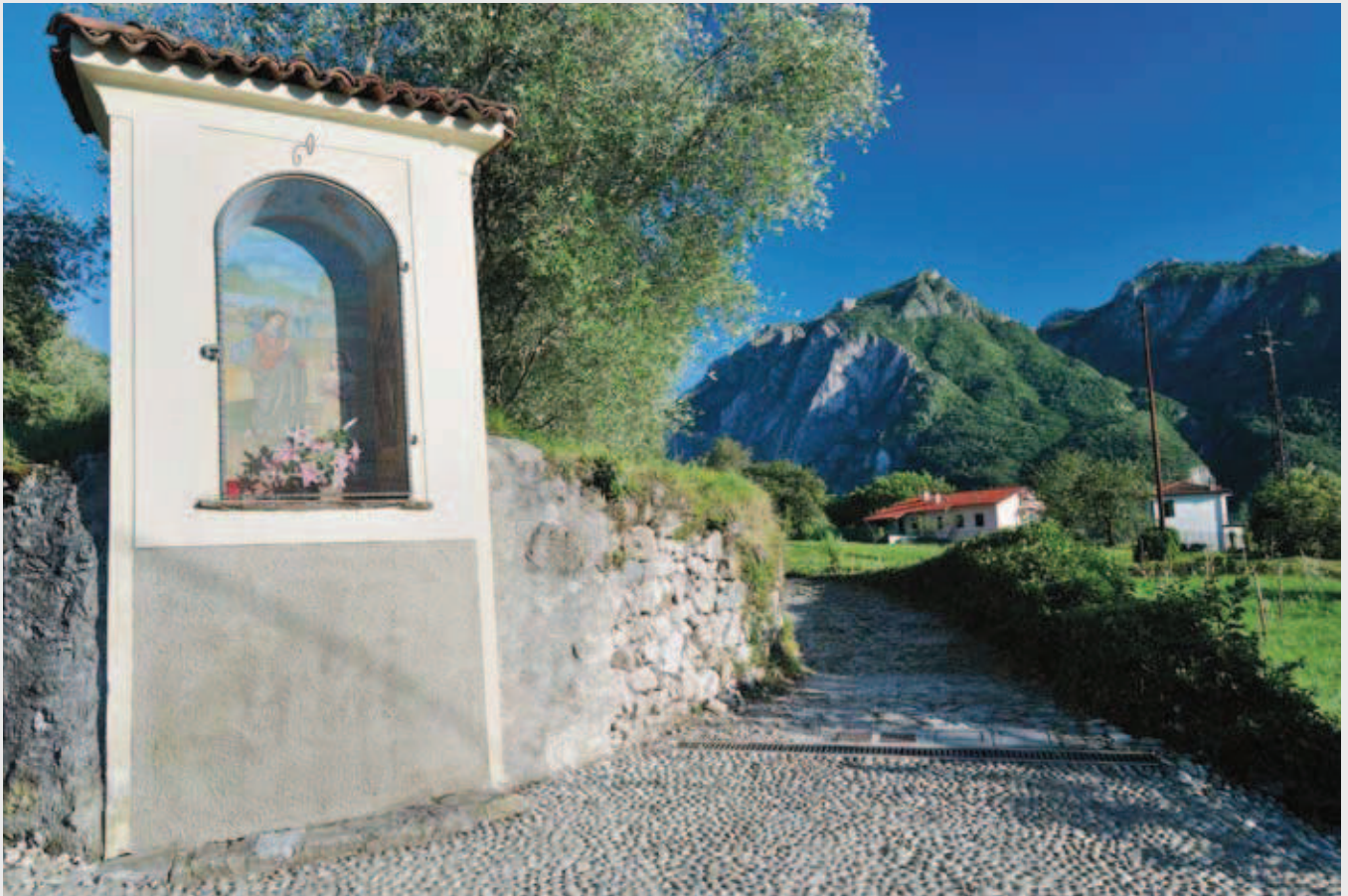
Cappella votiva nei pressi di Abbadia. In basso: la Torre del Barbarossa a Maggiana che ospitò l'imperatore germanico nel 1158.

Il Sentiero del Viandante, oltre al suo grande interesse paesaggistico, è anche ricco di storia. Non sarà difficile trovare lungo il nostro itinerario, infatti, tutta una serie di torri, fortificazioni, oltre ai numerosi edifici religiosi dal grande valore artistico ed architettonico.