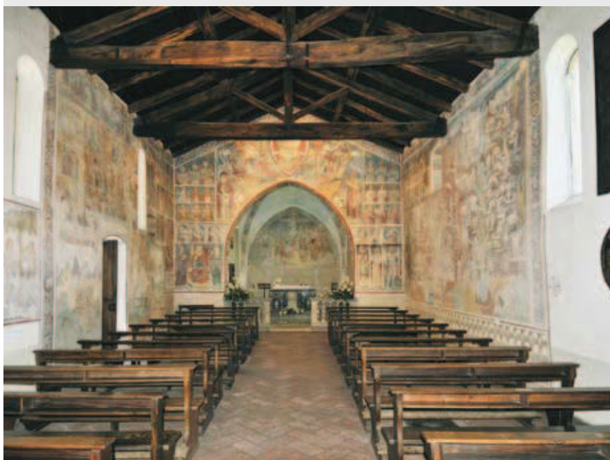
L'interno della Chiesa di San Giorgio.

Abbadia deve il suo nome all'abbazia benedettina fondata nel IX secolo di cui restano alcune tracce nell'attuale parrocchiale di San Lorenzo. Sullo sperone roccioso a cavallo tra Abbazia e Mandello troviamo la chiesa di San Giorgio, uno degli edifici di maggiore pregio del Lario. L'origine dell'edificio è molto antica, come dimostra l'acquasantiera marmorea del IX/X secolo, ma la struttura è del Duecento. Interessanti sono soprattutto gli affreschi del Quattrocento dove vengono rappresentati un fantasioso Inferno e di contro il Limbo e il Paradiso e, inoltre, la rara figurazione delle Opere di Misericordia, che sembrano richiamare la pittura ligure-piemontese. Per visitare l'interno della chiesa bisogna rivolgersi al caseggiato a lato.