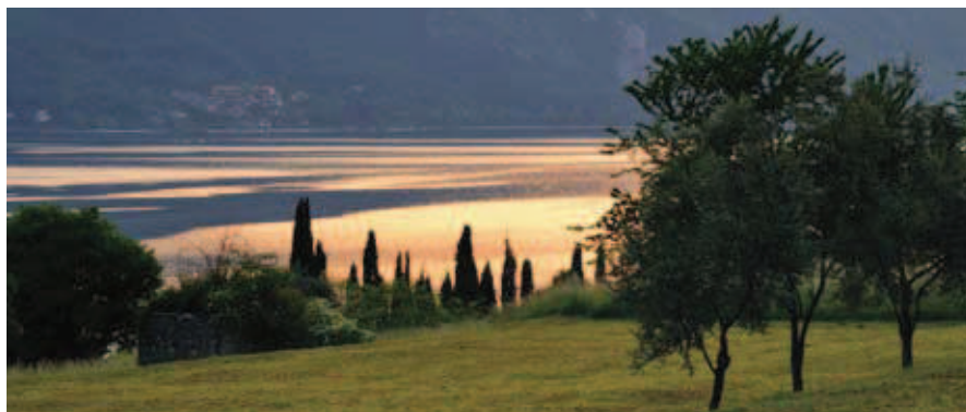
Tramonto sul lago nei pressi di Abbazia.

Ma tutto è rinviato al prossimo numero: la nostra tappa finisce qui a Lierna (m 207, ore 1:45) da dove possiamo comodamente tornare ad Abbazia con il treno.