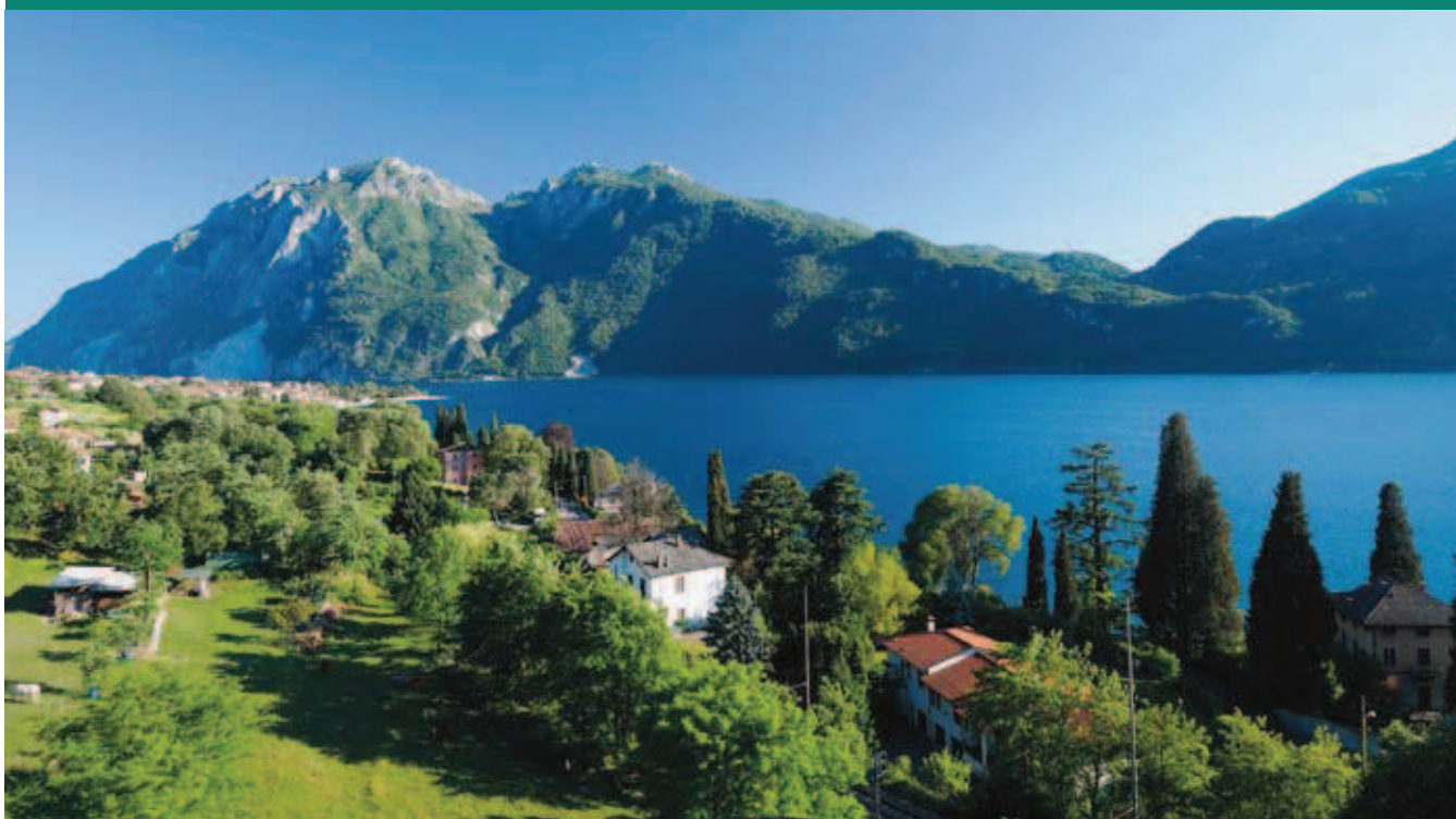
Panorama verso il Moregallo (tutte le foto di questo articolo sono state realizzate il 2 giugno 2009 da Enrico Minotti). Alla pagina precedente: verso Rongio.