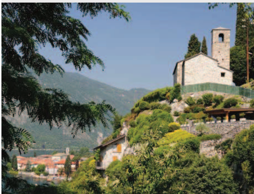
Verso la Chiesa di San Giorgio tra Abbazia e Mandello.

Nel 1828 un muratore stava smurando il camino al primo piano, quando rinvenne una lapide di granito tutta annerita dal fumo. Pulita e lavata, apparvero le parole: FRIDERIC - IMPERAT - GERMAN HIC - TUTUS - QUIEVIT - ANNO 1158 (Federico, imperatore di Germania,