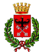
Comune di Chiavenna