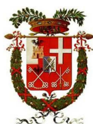
Provincia di Sondrio