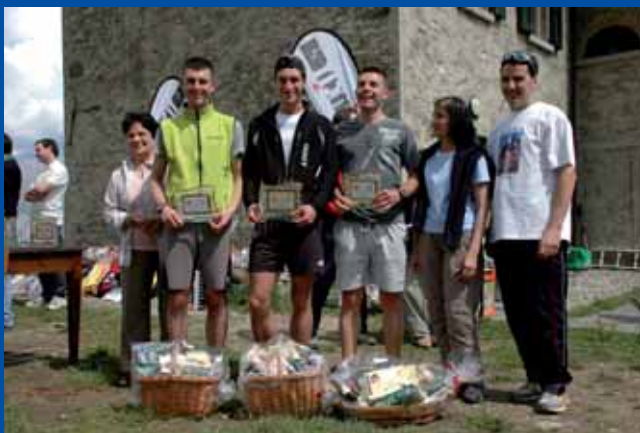
I primi 3 classificati juniores