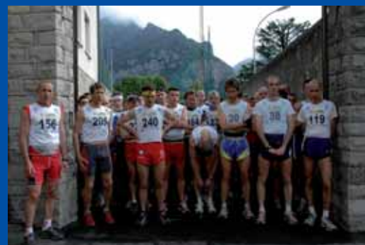
La partenza dal Centro Giovanile