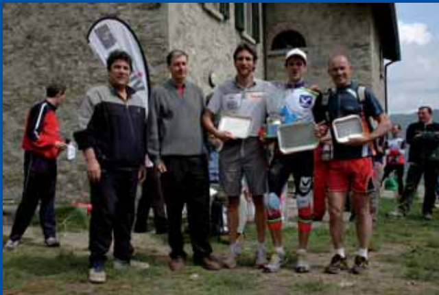
I primi tre classificati assoluti