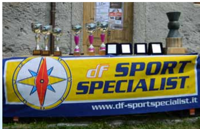
Il tavolo delle premiazioni