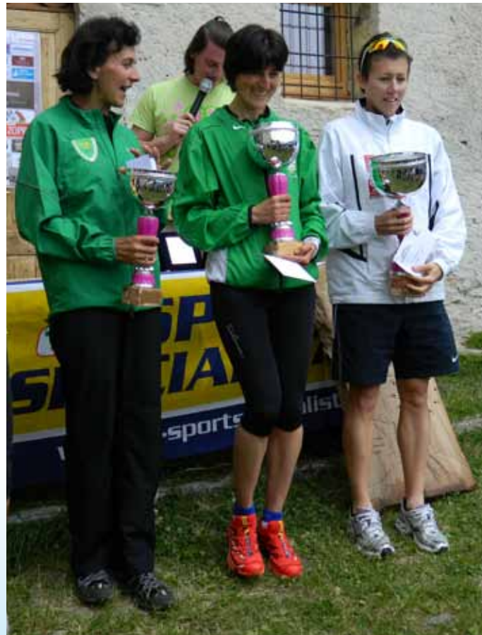
Le prime tre classificate